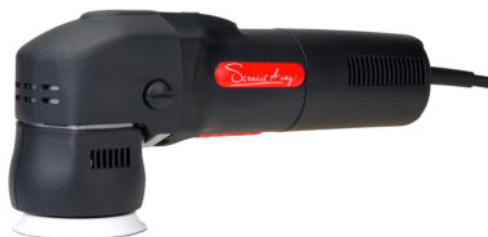
Scratch Away SAW195 machine