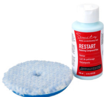
RESTART polijstmiddel met polijstschijs blauw