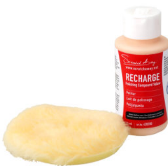
RECHARGE polijstmiddel met polijstschijs geel